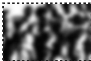
Plataforma cheia: quanto mais ruído, mais interferência