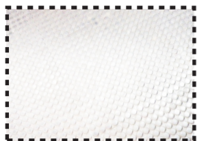
Plataforma vazia: sem ruído, detecção de presença nula